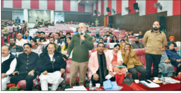
मीटिंग में मौजूद पार्षद