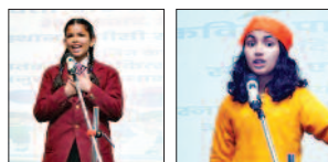
बच्चों के लिए किया गया। कार्यक्रम में ड्राइंग और रंगाई प्रतियोगिता के

चंडीगढ़/यूटर्न/26 दिसंबर। पीजीआईएमईआर, चंडीगढ़ ने एडवांस्ड पैडियाट्रिक सेंटर (अडउ) में बच्चों के लिए वीर बाल दिवस के अवसर पर विशेष कार्यक्रम आयोजित किए। यह आयोजन अडउ में भर्ती बच्चों और अस्पताल आने वाले