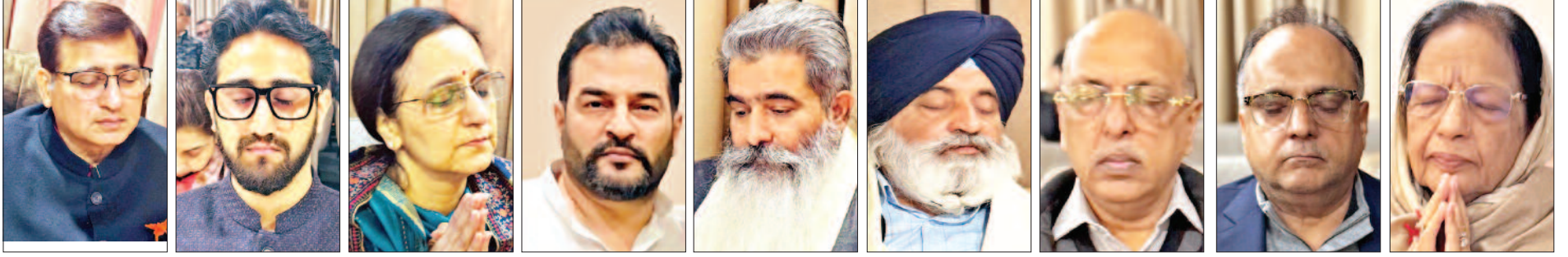
संत अश्वनी बेदी जी