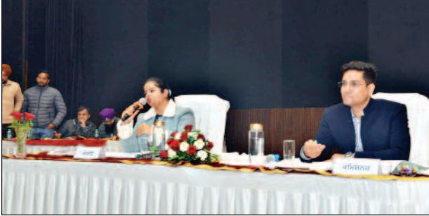
मीटिंग में मौजूद निगम कमिश्नर व मेयर