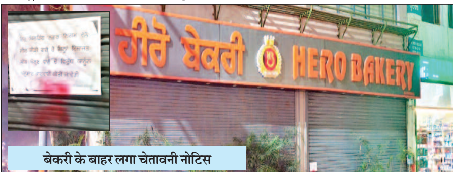
बेकरी के बाहर लगा चेतावनी नोटिस

उनके इन प्रयासों को रंगत मिली है। बता दें कि यूटर्न टाइम्स अखबार द्वारा लगातार हीरो बेकरी इललीगल होने और