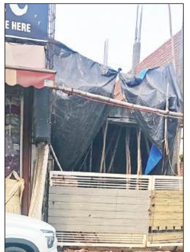
शास्त्री नगर में अबिका फैब्रिक्स के साथ सील की बिल्डिंग को मालिक ने खुद किया अनसील