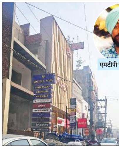
मॉडल टाउन मार्केट में मोची शोरूम के अपोजिट बन रही अवैध इमारत