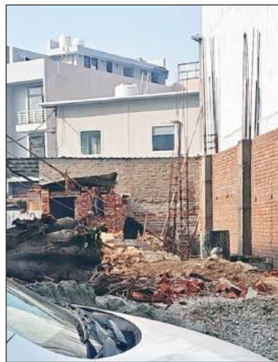
दीप अस्पताल के अपोजिट चल रहा अवैध निर्माण