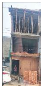
आत्म नगर हल्के में रिहायशी एरिया में बन रही कमर्शियल इमारत