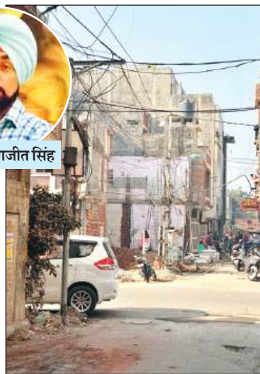
जवाहर नगर कैम्प में बन रही अवैध इमारत