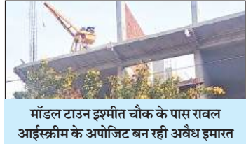
मॉडल टाउन इश्मीत चौक के पास रावल आईस्क्रीम के अपोजिट बन रही अवैध इमारत