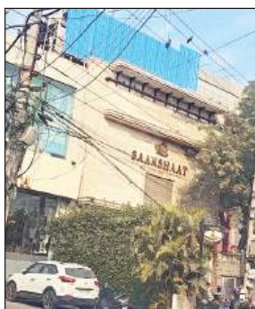
अंसल प्लाजा के साथ नॉन कंपाउंडेबल बिल्डिंग