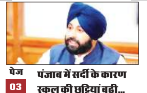
पेज 03 पंजाब में सर्दी के कारण स्कूल की छुट्टियां बढ़ी...