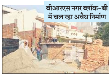
बीआरएस नगर ब्लॉक-बी में चल रहा अवैध निर्माण

निगम जोन-डी में चर्चाएँ हैं कि अगर किसी ने अवैध इमारत बनानी है, तो इस संबंधी इमारत बनाने से पहले या निर्माण के दौरान अफसरों से सेटिंग करो और जितना मर्जी, जैसे मर्जी निर्माण कर डालो। इसी के चलते चर्चाएँ हैं कि जोन के इन इलाकों में हो रहे अवैध निर्माण अफसरों की मिलीभगत से चल रहे हैं। जिसमें कई भ्रष्ट अफसरों को मोटी रकम तक पहुंच चुकी है। इसी कारण वह चुपी साधे बैठे हैं।