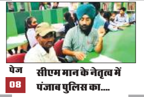
पेज 08 सीएम मान के नेतृत्व में पंजाब पुलिस का....