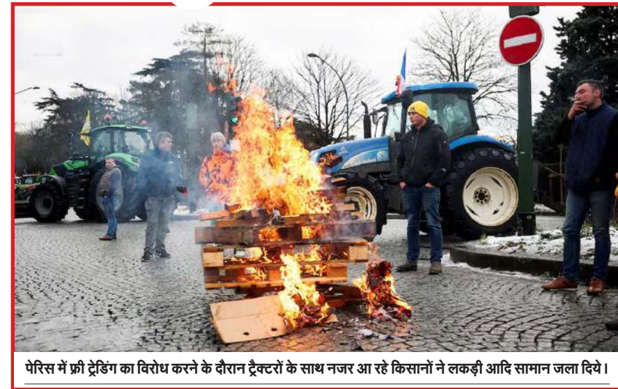
पेरिस में फ्री ट्रेडिंग का विरोध करने के दौरान ट्रैक्टरों के साथ नजर आ रहे किसानों ने लकड़ी आदि सामान जला दिये।