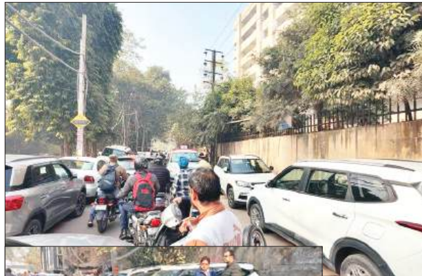
फिरोजगांधी मार्केट में फुटपाथ पर खड़ी कारों ने घेर रखी सड़क

बुद्धिजीवियों की सलाह : पार्किंग के पैसे न होने पर फोर व्हीलर चालक घर से बाहर न निकाले वाहन