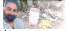
पेज 06 पैसों के लेनदेन में झगड़े के बाद दोस्त ने की हत्या