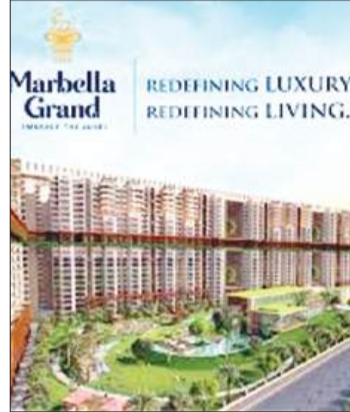
प्रॉपर्टी कारोबार में 'बड़े खेल' की जांच...सूत्र बताते हैं कि चंडीगढ़ और आसपास के इलाकों में प्रॉपर्टी कारोबार में लंबे समय से बड़े पैमाने पर