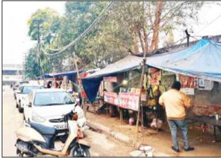
फुटपाथ व सड़कों पर लगी रेहड़ियां