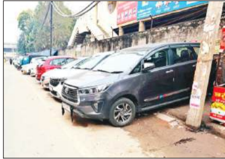
फिरोजगांधी मार्केट में फुटपाथ पर खड़ी गाड़ियां

अगर लोग ठेकेदारों को ज्यादा चार्ज लेने या फुटपाथों पर कब्जे करने की बात कहते हैं, तो आगे से ठेकेदार महंगा ठेका लेने का कहकर टाल देते हैं। अब हालात यह हैं कि सड़क का मोड़ मुड़ते हुए भी छोटी सी जगह पर जबरन वाहन खड़े कर दिए जाते हैं। लेकिन अब पंजाब सरकार द्वारा आईएस नीरू कत्याल को लुधियाना कारपोरेशन कमिश्नर नियुक्त किया है। जिसके चलते अब सभी शहरवासियों की नजर उन पर है। देखना होगा कि क्या अब आईएस कत्याल जनता को उनका हक दिला सकेगी या नहीं।