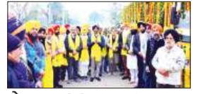
पेज 06 अनोखे अमर शहीद बाबा दीप सिंह जी के जन्मदिवस...