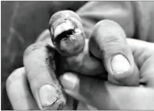
युवक के हाथ का उखाड़ा नाखून