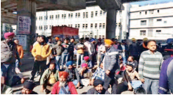
भारत नगर चौक जाम कर धरना देते हुए पीड़ित पक्ष के लोग