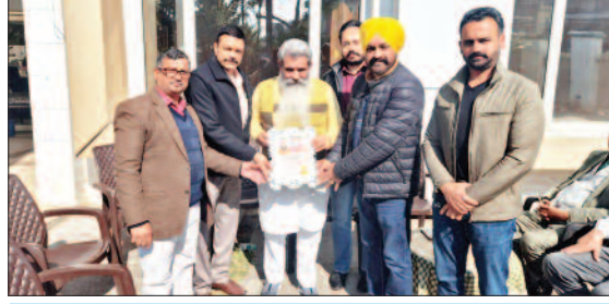
EX MINISTER BHARAT BHUSHAN ASHU JI