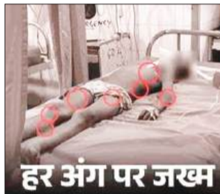
हर अंग पर जखम

पंजाब/यूटर्न/27 फरवरी। जालंधर में 5 कुत्तों के झुंड ने 6 साल के बच्चे को नोच-नोचकर मार डाला। वह अपनी मां के साथ खेत पर पिता को खाना देने गया था। जहां बच्चा शौच के लिए खेत में चला गया। इसी दौरान आवारा कुत्तों के झुंड ने उसे घेर लिया और उस पर हमला कर दिया। इस दौरान कुत्तों ने उसके सिर पर सबसे ज्यादा नोचा, इसके अलावा शरीर के अन्य हिस्सों पर भी काट लिया। बेटे के चिल्लाने की आवाज सुनकर माता-पिता भागे और बेटे को कुत्तों के चंगुल से छुड़वाया। इसके बाद वे तुरंत ही बच्चे को गंभीर हालत में इलाज के लिए सिविल अस्पताल लेकर पहुंचे, जहां इलाज के दौरान उसने दम तोड़ दिया।