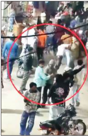
जीवन नगर में दुकानदारों पर हमला करते युवक

लुधियाना/यूटर्न/27 फरवरी। लुधियाना में पिछले कुछ दिनों के दौरान लगातार मारपीट की वारदातें सामने आ रही हैं। हालात यह हैं कि युवाओं द्वारा तेजधार हथियारों के साथ कहीं राहगीर पर तो कहीं दुकानदारों पर हमला कर दिया जा रहा है। हमलावरों द्वारा बिना किसी की प्रवाह किए सरेआम हमले किए जा रहे हैं। ऐसी ही दो नई घटनाएं सामने आई हैं। जिसमें पहली घटना थाना फोकल प्वाइंट के अधीन आते जीवन नगर और दूसरी किरपाल नगर की है। जीवन नगर में तो अपराधियों ने जमकर उतपात मचाया। हालांकि दोनों मामलों की वीडियो सामने आई है। लेकिन इन दोनों मामलों में हमलावर युवा हैं, जिसमें कई शायद नाबालिग भी हो सकते हैं। ऐसे में आखिर इन युवाओं के गलत रास्ते पर चलने के पीछे असली कसूरवार कौन है। क्या पुलिस प्रशासन की ढीली कार्रवाई है या पेरेंट्स का अपने बच्चों पर कंट्रोल नहीं है। दोनों में किसी का भी कसूर हो, लेकिन क्या ऐसे में हालात खराब होते रहेंगे या इन पर काबू पाया जा सकेगा।