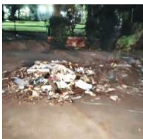
कई दिनों से यहां नियमित सफाई

अजीत झा चंडीगढ़, यूटर्न, 27 फरवरी। पोल्ट्री फार्म चौक से चंडीगढ़ रोड स्थित रेलवे ब्रिज के पास और इंडस्ट्रियल एरिया फेज की ओर जाने वाले मार्ग पर फैली गंदगी को लेकर स्थानीय लोगों में रोष है। सड़क किनारे भारी मात्रा में जमा कूड़ा-कबाड़ से क्षेत्र की स्थिति बेहद दयनीय बनी हुई है। स्थानीय निवासियों के अनुसार