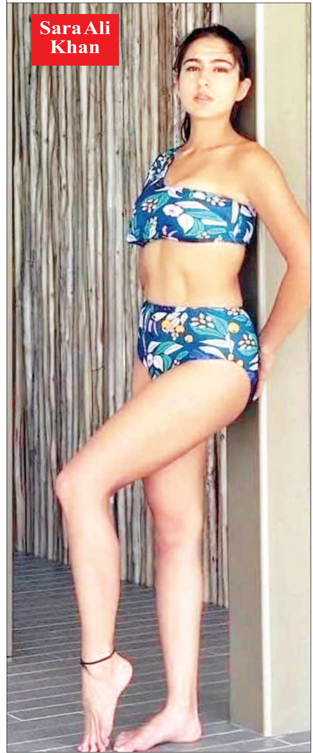
Sara Ali Khan

समय तक चीजे ठीक रहेगी में ऐसा मानता हूँ, उन्होंने कहा एक न एक समय आएगा यह सारी समस्या समाप्त होगी। मनोहर लाल ने कहा फिर भी हमारा निवेदन है जो सफ़ाई है उसी के हिसाब से काम चलाएं। उन्होंने लोगों से अपील की कोई भी पैनिक मत फैलाए। भारत सरकार जनता के साथ खड़ी है। उन्होंने कहा मैं तो यह कहूंगा पेट्रोलियम पदार्थ और गैस इससे कमी महसूस होती है तो पावर के नाते से ई कुकिंग की और आगे बढ़े। पावर हमारे पास पर्याप्त है। बिजली का उपयोग करके अपनी सब जरूरतों को पूरा करें, उन्होंने कहा हमने अपील की है जीतने वाहन बसे, ई ऑटो। चलाएंगे उतना हमारे पेट्रोलियम पदार्थ में भी बचत होगी।