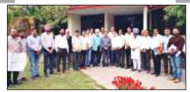
पेज सेक्टर-26 ट्रांसपोर्ट एरिया में विकास कार्यो कासीवर...