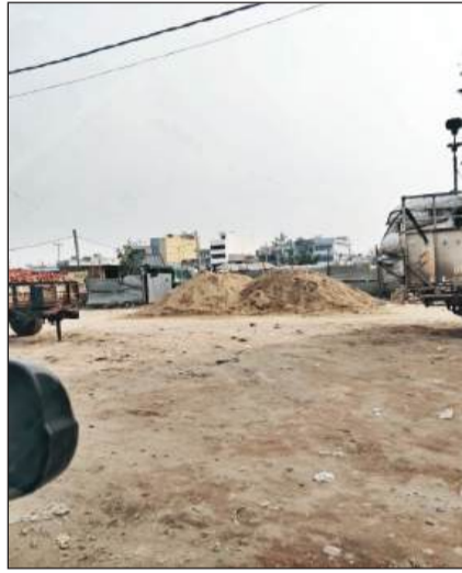
अनाज मंडी में लगा प्लांट और खुले में पड़ा रेत